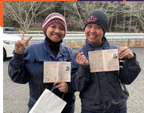
日本語能力試験の合格通知を受け取った実習生